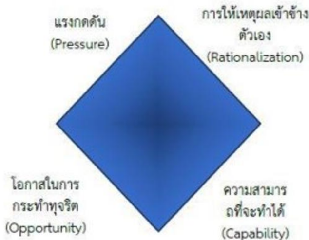
การพัฒนาของทฤษฎีสี่เหลี่ยมการทุจริต (Four-sided Diamond)